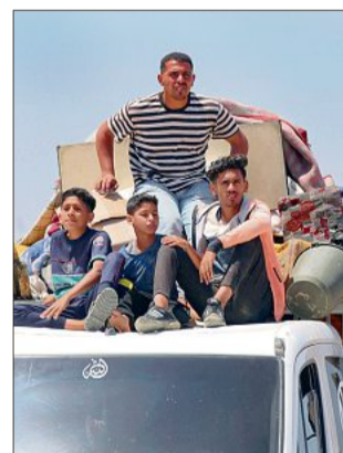
Desplazados en Gaza.

Israel para que no avance sobre esa localidad palestina. El plan de Israel en Rafah "corre el riesgo de provocar enormes daños en la población civil sin resolver el problema", estimó el secretario de Estado en entrevista con NBC. INTERNACIONAL / B1